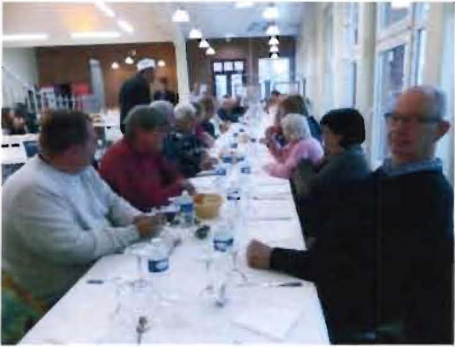
Accueil au lycée par Madame la Secrétaire générale