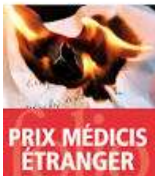
Philip Roth La tache

Quelques unes de ses œuvres les plus connues et sans doute les plus marquantes :