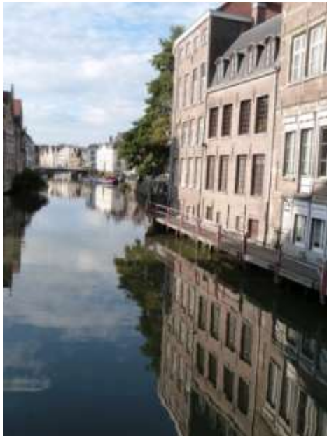
Au fil des canaux