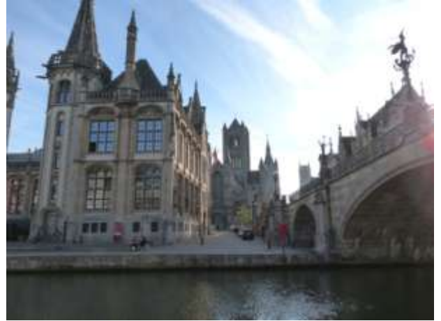
En enfilade, les 3 tours de Gand