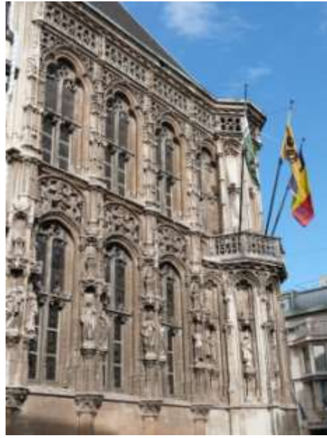
Partie de l'Hôtel de Ville