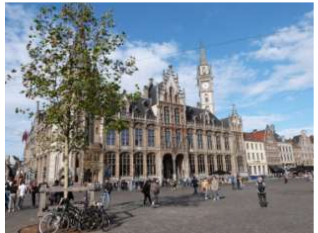
Vu de la place de l'Hôtel de Ville