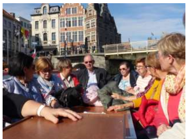
L'un des deux groupes, attentif aux explications de leur guide avant de prouver avoir leur pied marin !!