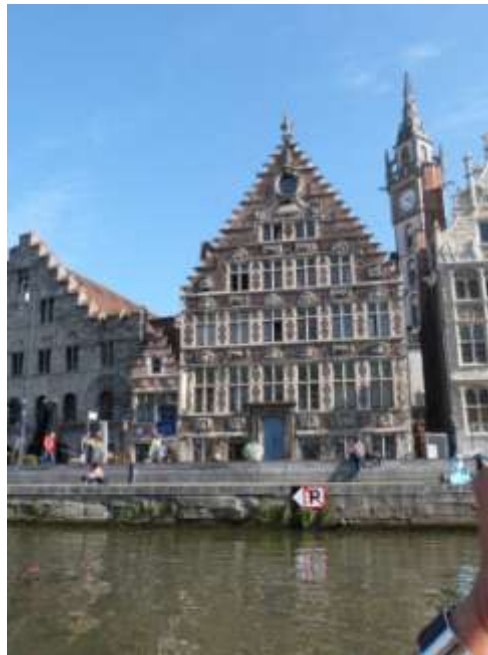
Les maisons des bateliers francs et non francs et le Tonlieu