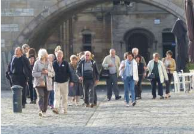
Notre arrivée sur le Korenlei rive gauche du port