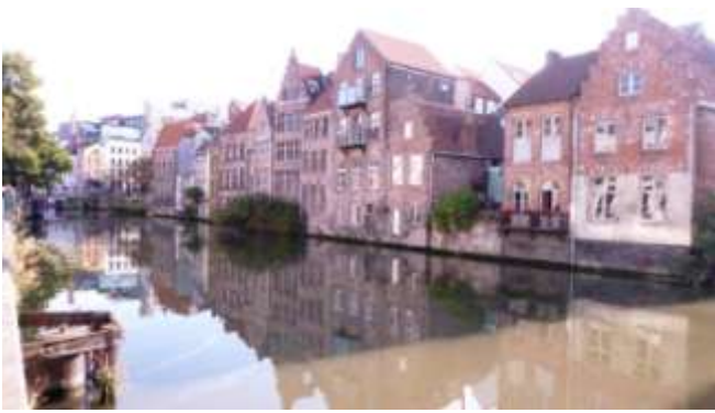
Au fil des canaux