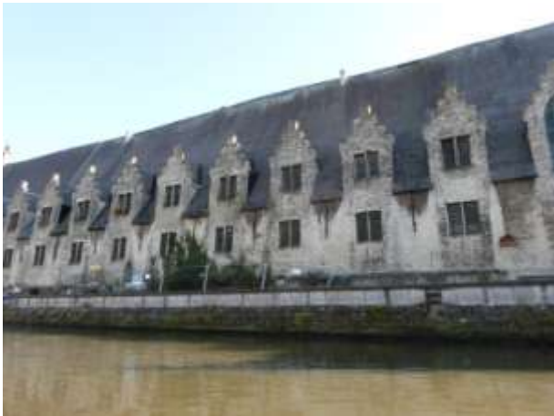
Ancienne filature transformée en résidence étudiants