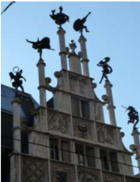
La maison des maçons