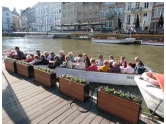
Retour du deuxième groupe de plaisanciers

Une superbe journée ensoleillée mi octobre, une ville très riche de monuments, églises, musées ... Il faut y revenir pour compléter le plaisir que nous y avons trouvé.