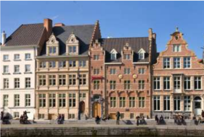
L'Hôtel Marriott avec les 2 cygnes dos à dos ...