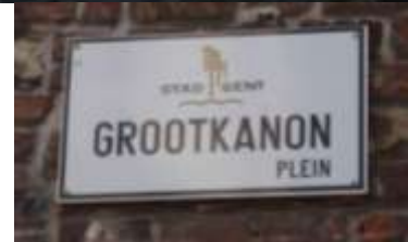
Le Gros Canon ou le Grand diable rouge