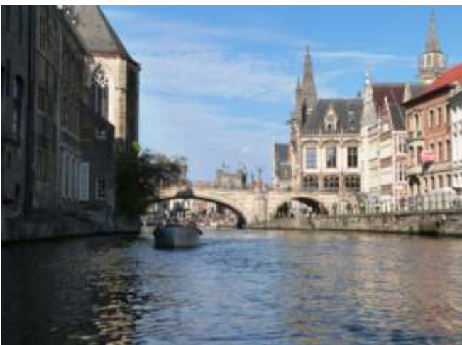
Le pont St Michel vu par le canal