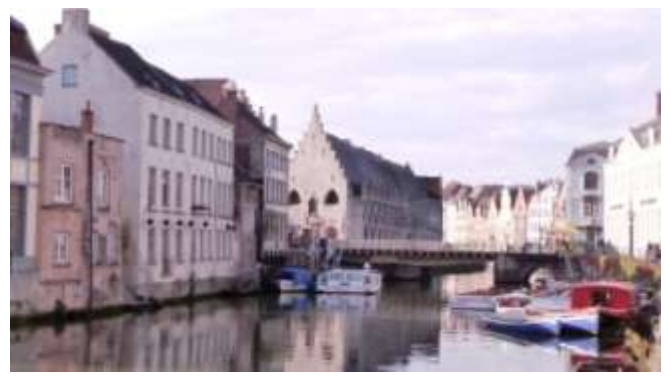
Au fil des canaux