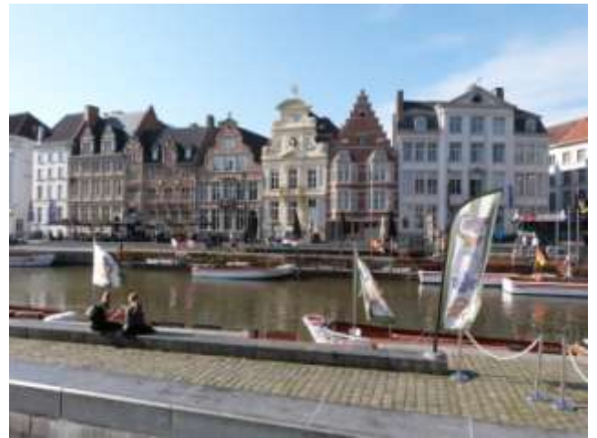
Le port de Gand