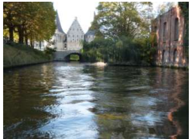
Les tours du Rabet de Gand