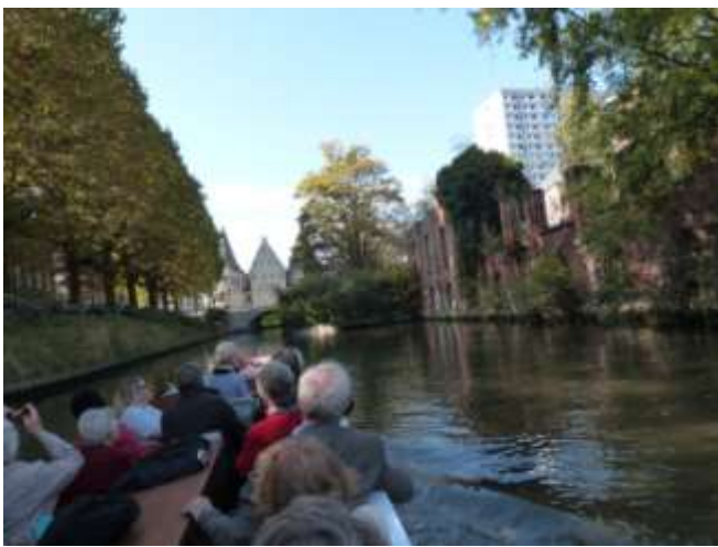
Le premier groupe de plaisanciers