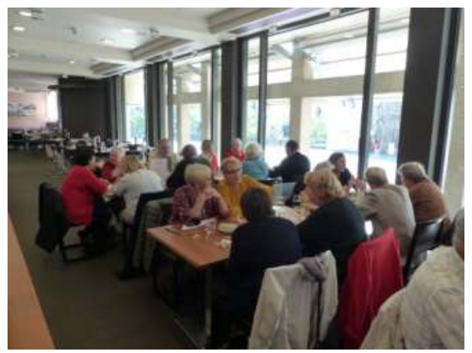
Sans oublier le repas réservé par notre autocariste au Novotel de Gand.