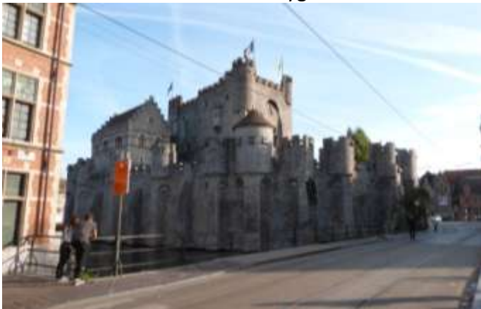
Le château des Comtes vu de la route