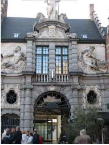
L'ancien marché aux poissons Avec Neptune au sommet